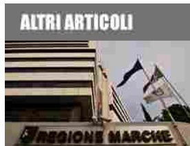
Sisma, le Marche stanziano un milione per aziende che assumono nel cratere

Giovedì 9 Novembre 2017, 16:32 - Ultimo aggiornamento: 09-11-2017 16:32