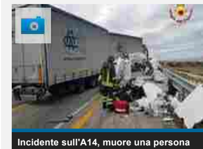
Incidente sull'A14, muore una persona