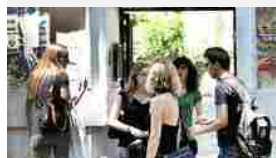
Scuole superiori, ecco le migliori d'Italia città per città: le marchigiane