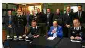
Fermo, maxi operazione antidroga Arresti e perquisizioni dei carabinieri