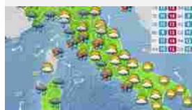
Meteo, torna il maltempo: oggi Italia divisa in due, da domani rovesci al Sud