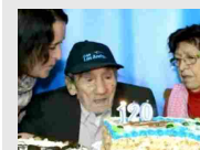
L'uomo più vecchio del mondo ha 121 anni ma non può dimostrarlo