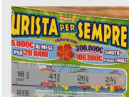
Prende il solito gratta e vinci Va a casa e scopre di essere stato fortunatissimo